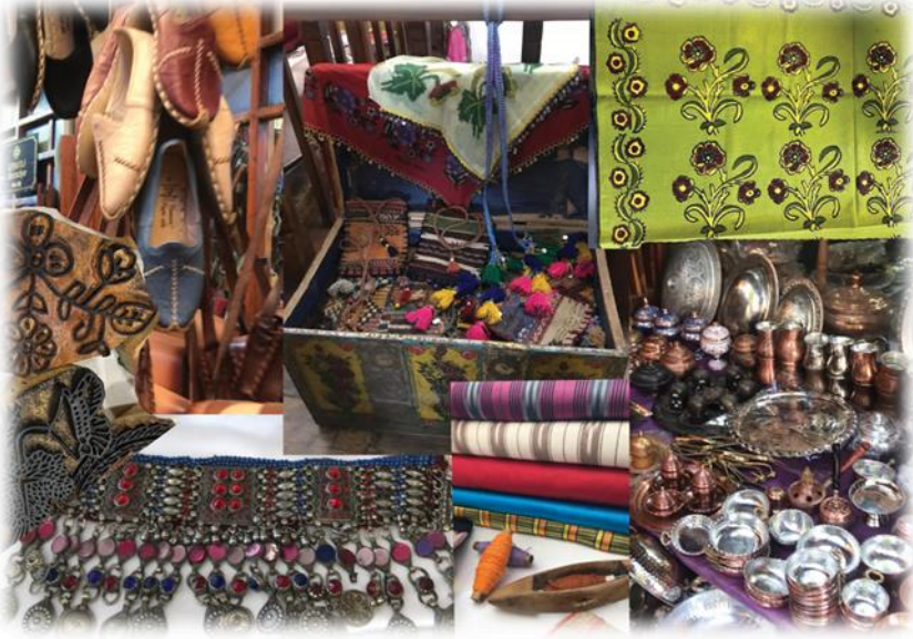
Görsel 1: Geleneksel Türk El Sanatları.

sosyal, ekonomik, toplumsal, kültürel, siyasal, sanatsal değerleri etkiler. Geleneksel el sanatları ise bu değerlerin temsil ettiği nesnelere etkileşimin bir parçası olur. İnsanlık tarihinin en eski kültürel ifade aracı olan el sanatları, doğada bulunan malzemeleri kullanılarak yapılmaya başlanmıştır. Zamanla estetik ve sembolik anlamlar kazanmış kültürel mirasın aktarıcısı olmuştur. Anadolu, zengin sanatların yaşadığı tarihi ve kültürü binlerce yıl öncesine dayanan bir coğrafyadır. Bu coğrafyada oluşan sanatlar günümüzde de geleneksel olarak devam eden birçok el sanatı barındırmaktadır. Bunlar çini, tezhip, keçe, dokuma, halı, çömlek, seramik, ebru, minyatür, yazma vb. olarak sıralanabilir (Görsel 1).